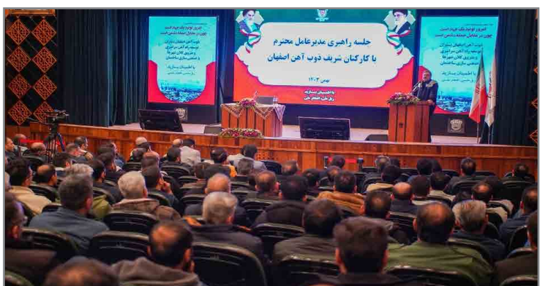
خانواده بزرگ ذوب آهن تأکید کرد و همدلی و اتحاد را راهکار اصلی غلبه بر چالش ها برشمرد.

جلسه راهبری سید اردشیر افضل، مدیرعامل شرکت سهامی ذوب آهن اصفهان، روز یکشنبه ۷ بهمن ماه با حضور تلاشگران این مجتمع عظیم صنعتی در تالار آهن روابط عمومی برگزار شد. در این نشست، مدیرعامل ذوب آهن اصفهان به نقش محوری کارکنان در پیشرفت داشت که تخصص و توانمندی کارگران ذوب آهن مهم ترین سرمایه برای بهبود شرایط این مجموعه است. وی شایسته سالاری و عدالت در محیط کاری را اصلی ترین عامل برای افزایش انگیزه و بهره وری دانست و گفت: بدون اجرای اصول، نمی توان به اهداف بزرگ شرکت دست یافت. افضلی در بخش دیگری از سخنان خود بر لزوم توجه به نیازها و مشکلات