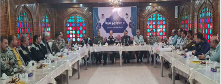
رایاد آور شد و گفت: با توجه به شرایط خاص موجود و تهدیدهای استیکار جهانی و جنایت‌های رژیم پست

آیین تکریم و معارفه فرمانده یگان پدافند هوایی شهید صفاجو در ذوب آهن اصفهان با حضور سرهنگ نصیرپور فرمانده گروه پدافند هوایی شهید رفیعی اصفهان، و جمعی از مدیران و مسئولین ذوب آهن اصفهان، سپاه ناحیه نجان و فولاد سبا در محل باشگاه قدس برگزار شد.